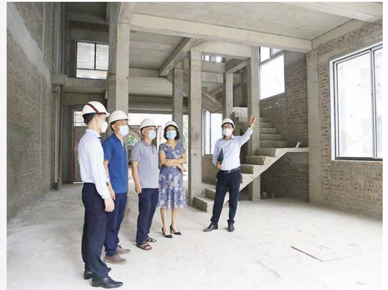
Khách hàng cùng đại diện Him Lam Land kiểm tra và hài lòng với chất lượng công trình

Song song với việc đảm bảo tiến độ, các quy tắc 5K trong phòng chống dịch Covid-19 luôn được áp dụng một cách nghiêm ngặt và triệt để. Đội ngũ kinh doanh cùng đơn vị thi công, nhà thầu... luôn phải mang khẩu trang, giữ khoảng cách an toàn và thực hiện sát khuẩn tại khu vực sàn giao dịch và công trường dự án.