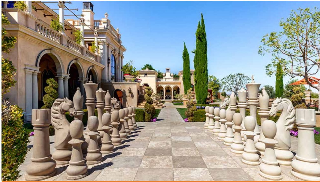
bộ cờ vua ngoài trời tại dinh thự giá 30 triệu USD thuộc khu Calabasas, California