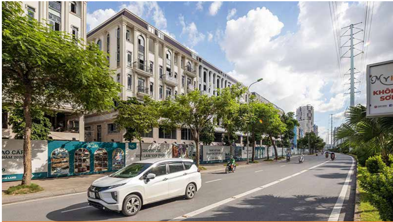
Thiết kế tối ưu vừa đầu tư – kinh doanh vừa an cư của Him Lam Vạn Phúc