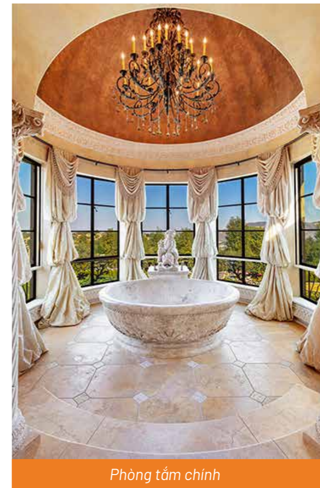
Phòng tắm chính