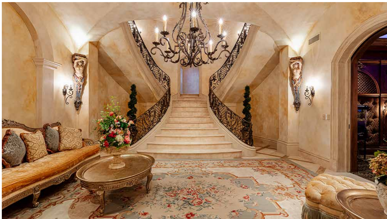
Lối vào biệt thự