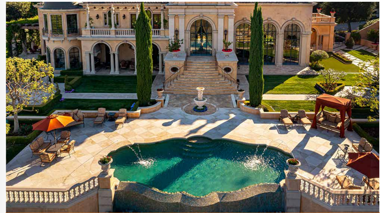
Hồ bơi ngoài trời