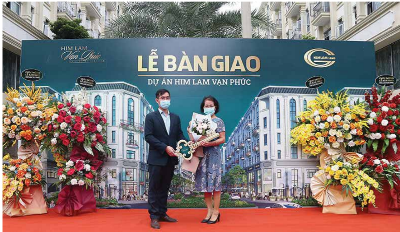
Khách hàng vui mừng nhận chìa khóa bàn giao Shophouse Him Lam Vạn Phúc

Vừa qua, theo đúng tiến độ cam kết, Công ty cổ phần Kinh doanh Địa ốc Him Lam (Him Lam Land) đã tiến hành bàn giao những căn shophouse đầu tiên cho chủ nhân Him Lam Vạn Phúc.