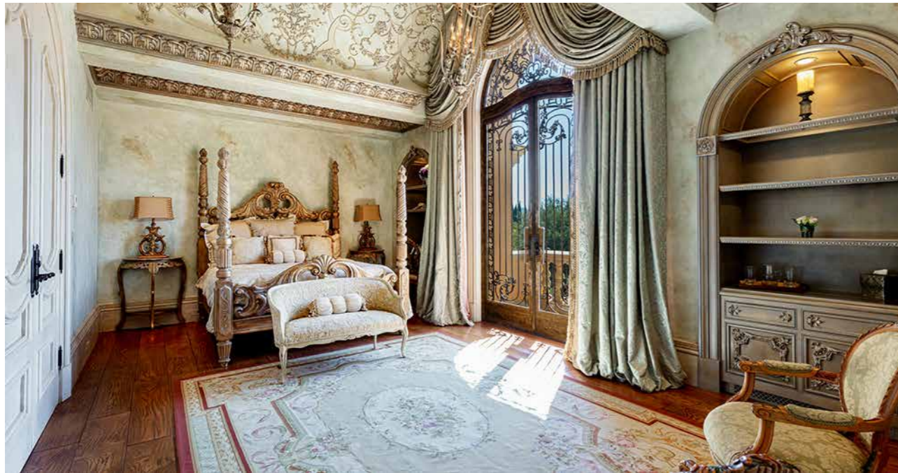
Một trong những phòng ngủ

Dinh thự nằm trên một khu đất có diện tích gần 1 hecta với nhiều tiện ích ngoài trời cực kỳ thú vị. Nếu không còn hứng thú làm một ván cờ với những quân cờ cao hơn 1,8 mét, bạn có thể thỏa sức ngâm mình trong hồ bơi vô cực, chơi golf tại gia hoặc thưởng thức bữa tối ngoài trời tại một trong những không gian giải trí trong khuôn viên dinh thự.