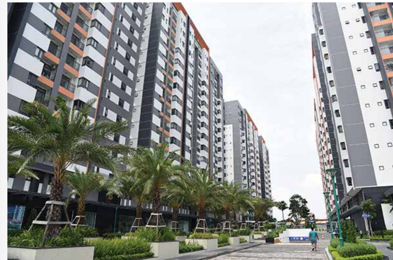
Chung cư Him Lam Phú An (TP Thủ Đức)

Trong thời gian tới, Him Lam Land sẽ liên tục cập nhật những thông tin mới nhất về tiến độ thực hiện việc di dời đến Quý khách hàng, Quý cư dân. Him Lam Land xin chân thành cảm ơn Quý khách hàng, Quý cư dân đã luôn tin tưởng và đồng hành với dự án của Công ty chúng tôi trong suốt thời gian qua.