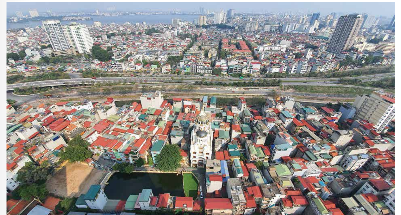
Thị trường BĐS được dự báo phục hồi trong những tháng cuối năm.

"Thị trường BĐS cuối năm được dự báo nhiều hứng khởi, nhà đầu tư nhỏ lẻ truyền thống, suy giảm lực đầu tư, nhưng thị