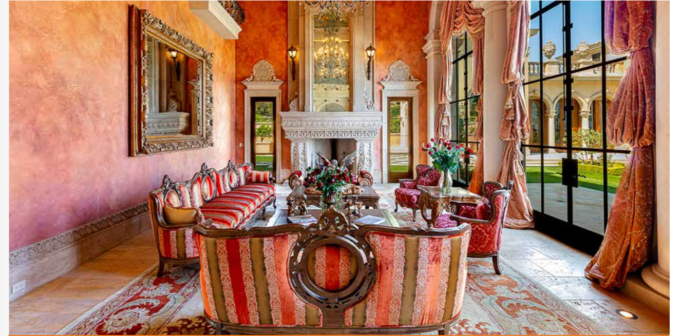
Sảnh khách lớn trong dinh thự

Dĩ nhiên, dinh thự của Gibson cũng nằm trong số những dự án mà Hablinski đặc biệt để tâm. Cơ ngơi có diện tích gần 1.500 mét vuông và được lắp đặt hệ thống lò sưởi từ đá travertine, ban công Juliet (ban công nhỏ vừa đủ cho 1-2 người) và những đường gờ tùy biến tỉ mỉ. Ngôi nhà sở hữu 5 phòng ngủ và 7 phòng tắm, một nhà khách riêng biệt với 2 giường ngủ và 2 phòng tắm.